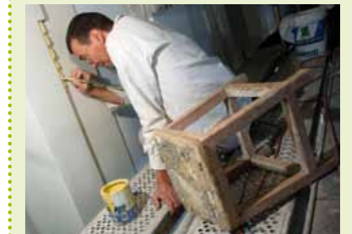
Un peintre décorateur lors de la restauration de dorures

Pour assurer la maintenance des bâtiments publics de l'Etat et la réalisation de ces différents travaux, en plus des conducteurs de travaux et des conducteurs d'opérations, le Service de Maintenance des Bâtiments Domaniaux compte dans ses effectifs des ouvriers au sein d'un Service Interventions Urgentes.