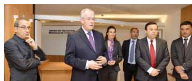
Le contact humain étant primordial en terme d'accueil, plusieurs sessions de formation ont été menées pour améliorer la qualité de l'accueil physique et téléphonique. La réhabilitation de locaux qui reçoivent quotidiennement du public représente une autre priorité dans cette opération. Ainsi récemment, le hall du Ministère d'État, les Services Fiscaux (photo), le Service des Prestations Médicales de l'État ont fait peau neuve. Ces travaux font partie d'un plan pluriannuel de remise à niveau qui concernera plusieurs points d'accueil dans les prochains mois (voir prochain numéro du JDA).