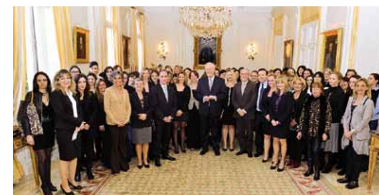
En conviant le personnel en charge de l'accueil, le Ministre d'État a rappelé qu'il s'agit de l'une des priorités de la politique de modernisation du Gouvernement, qui a pour objectif de définir les standards et les bonnes pratiques d'un accueil de qualité.