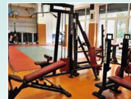
Les critères de sélection pour se présenter au concours :