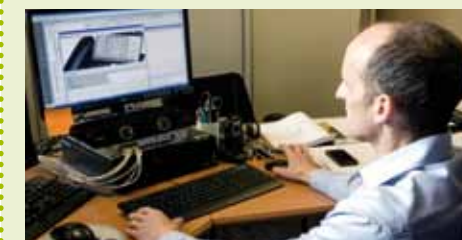
Le SMBP gère plus de 3500 lignes raccordées sur le réseau téléphonique de l'Administration comprenant entre autres, le Palais de Justice, la Maison d'Arrêt, le Foyer de l'Enfance ou encore la Direction du Tourisme et des Congrès