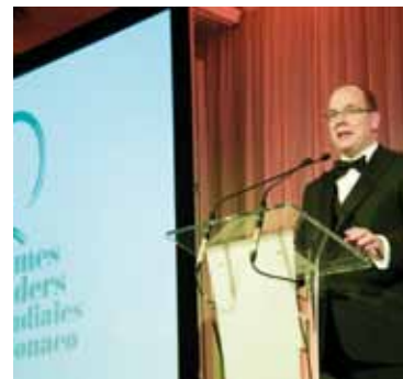
S.A.S. le Prince Albert II lors de la soirée de gala 2014 de l'Association des Femmes Leaders Mondiales de Monaco

C'est d'ailleurs à cette occasion qu'a eu lieu à Monaco la remise des prix du concours «Au cœur des mots» organisé par les Femmes Leaders Mondiales Monaco et en présence de S.A.S. le Prince Albert II, et qui bénéficie d'un soutien financier de la