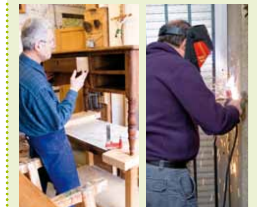
Ebéniste, un autre métier de la Cellule Interventions Urgentes du SMBP

Pour assurer la maintenance des bâtiments publics de l'Etat et la réalisation de ces différents travaux, en plus des conducteurs de travaux et des conducteurs d'opérations, le Service de Maintenance des Bâtiments Domaniaux compte dans ses effectifs des ouvriers au sein d'un Service Interventions Urgentes.