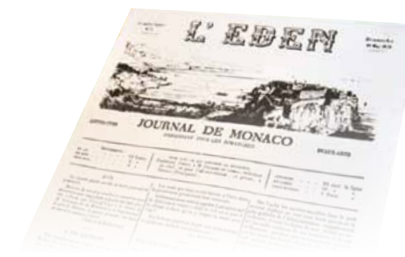
Ce sont les abonnés tels que les officiels de la Principauté qui en constituent les lecteurs les plus assidus. A l'autre bout du monde ou dans les limites du Rocher, le Journal Officiel trouve un écho toujours apprécié.

La mise en page du Journal est composée de nombreux textes dont la plupart émanent des Ordonnances Souveraines, Arrêtés Ministériels et plus généralement des délibérations du Conseil de Gouvernement. Cependant, le tout peut parfois être également complété d'annexes comme c'est le cas pour certains débats du Conseil National, ou le vote des lois.