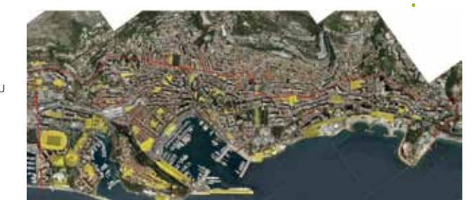
Plan de repérage des bâtiments entretenus par le SMBP (en jaune)

Découvrez ces métiers plus en détail dans les chroniques « A la découverte de nos métiers » dans un prochain JDA