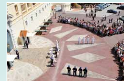
Le métier de base des Carabiniers est de protéger le Prince, sa Famille et le Palais Princier, cependant ils ont souvent des spécialités :

L'aptitude à la gestion d'un conflit et la capacité à respecter les consignes sont les deux qualités demandées pour pouvoir entrer dans le Corps des Carabiniers du Prince. En été, lors de la relève de la garde, il y a environ 6 carabiniers pour 3000 spectateurs, ces deux facultés sont primordiales en cas de débordements.