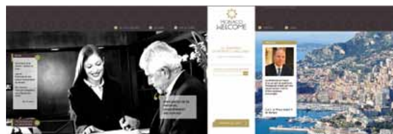
Un site Internet a été créé www.monaco-welcome.mc . Géré par le Monaco Welcome & Business Office, il permet aux entités souhaitant obtenir le label « Monaco Welcome Certified » d'effectuer les démarches en ligne. Ce site est également un outil de présentation et d'actualité et joue un rôle essentiel dans la démarche. Il s'agit d'un lien entre tous les acteurs de l'accueil.

Enfin, afin de jauger la qualité de l'accueil en Principauté, le Gouvernement a procédé à la mise en place d'une vaste série d'enquêtes professionnelles de satisfaction auprès des usagers (Circulation, Parkings, cartes des résidents, Direction du Tourisme, Service de l'Emploi...)