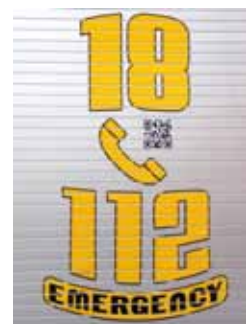
De plus, un tag (code QR) disposé sur chaque engin à proximité des numéros d'urgence 18 et 112 assure une connexion immédiate au site web à partir d'un smartphone. Un deuxième tag sur la portière du conducteur fournira les spécifications techniques du véhicule flashé.

Beaucoup plus convivial, le nouveau site s'intègre parfaitement dans le paysage web du Gouvernement (gov.mc) en y apportant des informations complémentaires sur l'organisation du Corps, son histoire, ses activités et ses véhicules d'intervention.